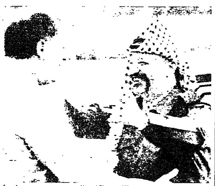
غندي يستقبل عرفات

هذا النوع في يومياتي ومكتب يومي هو الرابطة الدبلوماسية الوحيد بين الدولتين وكثير من قرارات الحكومة الهندية قبل سنتين السماح لفرقة تيس اسرائيل بزيارة الهند للعب مباراة في بطولة كأس ديفيز، ادى الى هذا التكتف وكادت تتابع فيه اسرائيل هجماتها اليومية على المخيمات الفلسطينية في لبنان. وتتهم السيد عرفات اسرائيل بمهاجمة مخيمات اللاجئين والقري في وقت سابق من عام ١٩٨٧، وقال ان اسرائيل تهاجم المخيمات والقري الفلسطينية في لبنان، وتصور دمشق لامن القومي العربي - الاسرائيلي وسراعات الحيازة العربية وموجز كل ذلك ان السلام العربي في لبنان هو السلام السوري.